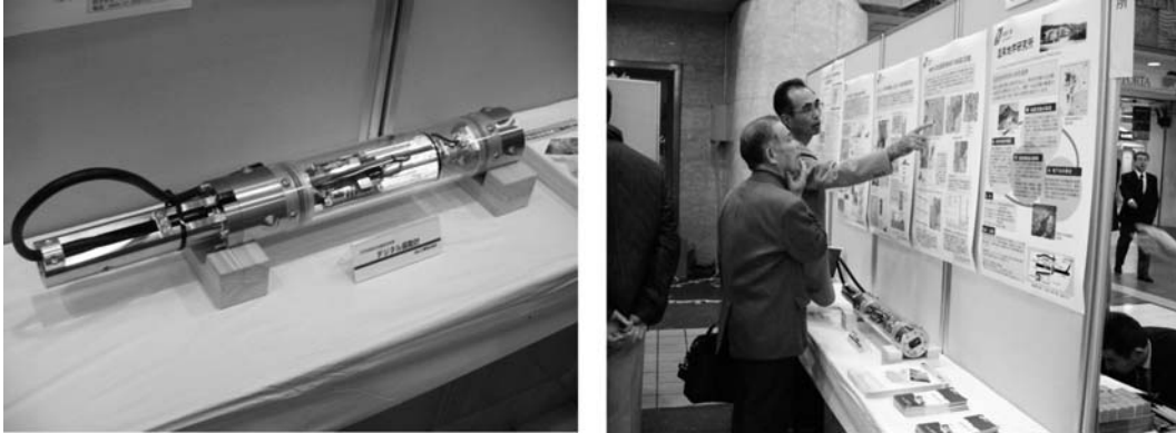
Fig. 2. Exhibition of seismometer at the 2008 Science forum of Kanagawa Prefecture.

震とその防災対策から説明し、地震観測装置を設置した学校名や住所を具体的に挙げ、首都圏地震観測網が身近なところに存在することを伝えた。そして、鶴岡・他(2009)が開発した学校向けコンテンツを紹介することで、その観測内容と防災情報の収集性の高さを解説した。地震観測装置の設置に協力していただいた市教育委員会に対しては、要望があればネット上のセキュリティを確認したうえで、学校向けコンテンツの操作方法を教えた。