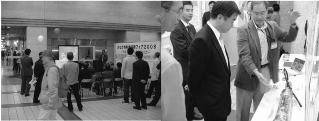
Fig. 3. Mini-presentation (left) and an explanation the exhibition of MeSO-net to the Kanagawa governor (right) at the 2008 Science forum of Kanagawa Prefecture.

部の中身はどうなっているのか?」,「展示してある地震計測部は作動するのですか?」という共通した質問があった。