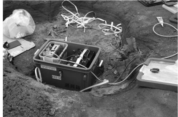
図 3. 箱に収納された機器。右側に写っている蓋には、GPS アンテナが取り付けられている。

するには密閉できる収納箱が望ましいが、今回使用する空気アルカリ電池は空気中の酸素を消費して発電するために、収納箱には通風孔を開けざるを得ない。そこで、収納箱を二重にして機器を保護することにした。外箱には通風孔を開けて電池のための酸素を取り入れられるようにした道具箱を使用し、内箱には密閉できるプラスチック容器を使用して収録装置と DC/DC コンバータを納めた（図 3）。外箱の側面には 5 つの通風孔を開け、塩化ビニルの L 字継手（内径 13 mm）に目の粗いスポンジの薄片を挿入したものを下向きに取り付けて雨水や虫が侵入しにくいようにした。また、日中の強い日差しで箱内が高温になるのを防ぐために、外箱の蓋の表にはアルミ蒸着したシートを貼り、裏には発泡スチロール板で裏張りをした。