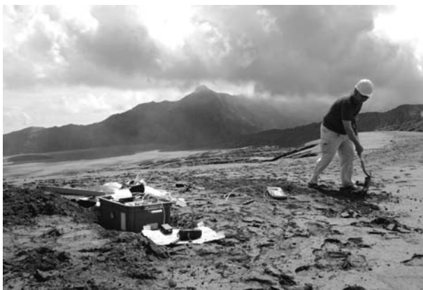
図 5. AFOK の設置作業風景