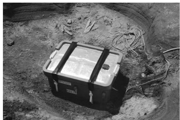
図 7. 設置が完了した ANNE (近景)