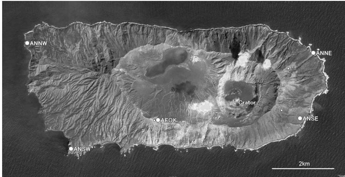
図 4. 設置した観測点の配置. 大きな○は今回設置した観測点. 小さな○は EMO と USGS の観測点.