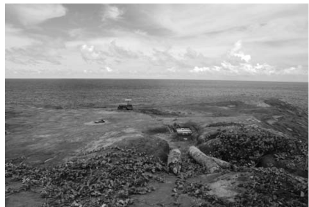
図 6. 設置が完了した ANNE (遠景). 左手にある GPS アンテナ・受信器は繰り返し測量の最中である.

タハン島まではチャーター船で一晩かけて移動し、ANNW 近くの砂浜に上陸した。上陸地点を基点として、サイパン島から飛来したヘリコプタで移動して観測点を設置した。設置は 2 名で行い、作業時間は概ね 1 時間以内であった。ただし、ANNW のみ、EMO 職員 1 名の協力を得て徒歩により設置に行った。観測開始日は AFOK、ANSW、ANNE、ANSE は 2008 年 6 月 25 日、ANNW のみ 2008 年 6 月 26 日である。