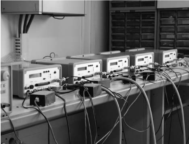
図 2. 地震研究所内で動作試験中の HKS-9500