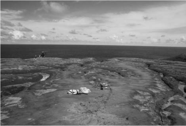
図 8. ANSE の設置作業風景