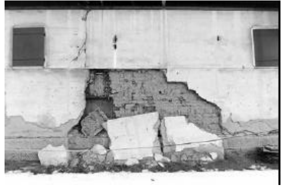
写真2 そば小川倉庫 土壁崩落