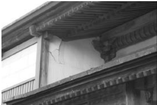
写真5 正行寺外壁 亀裂・剥離