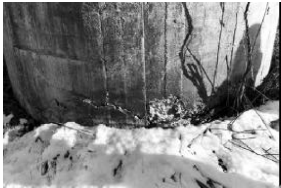
写真3 (株)ニッタクス十勝工場 ボイラー室煙突 脚部損壊