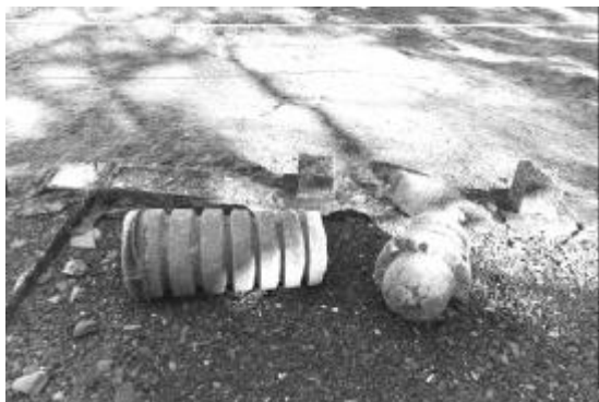
写真7 仏牙舍利塔 相輪倒壊