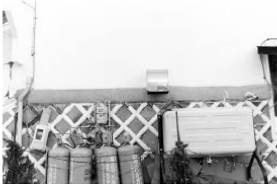
写真1 東印度会社 胴蛇腹漆喰部分