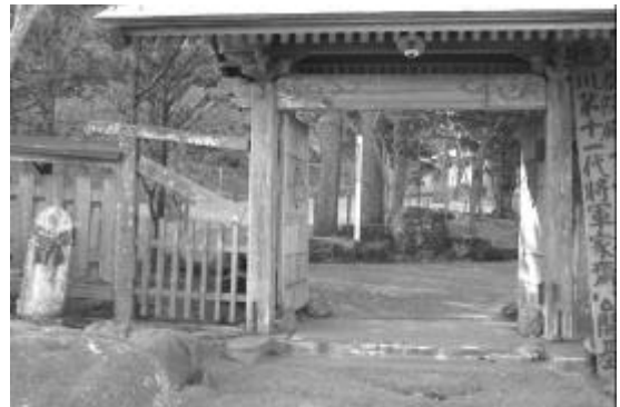
写真6 国泰寺跡山門 柵の水平材落下