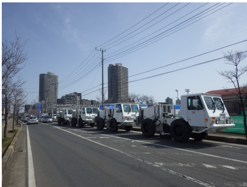
中型バイブレーター4台を使用した、都市部での発震作業風景。