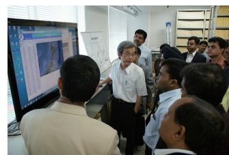
所内見学会 「ラボツアー」 Lab Tour