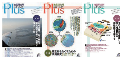
2008 年よりニュースレターを刷新 “ERI Newsletter Plus” since 2008

In viewing the importance of our mission to feedback our research products to many people, we have been carrying out various outreach activities. The Public Outreach Office was first established in 2003 and has now been renamed as Outreach and Public Relations Office in 2010. Our main roles are 1) to make the public outreach more effective and systematic, and 2) to grasp public needs to research activities and reflect them to our research projects. In order to accomplish them, the office has been promoting 1) public relations through the web site, publication, and the media, 2) public education through open house and public seminar, 3) education for the specialists and technicians of emergency services, and 4) cooperation with national and local governments.